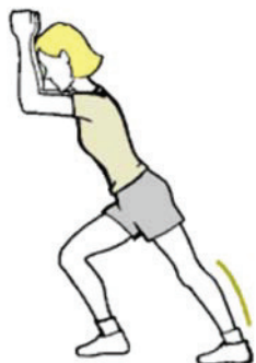
Figure B-17 Étirement des mollets

Changez de côté et reprenez l'exercice du côté opposé.