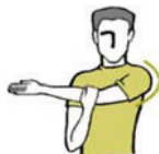
Figure B-5 Étirement des épaules

Remarque. Tiré de Sages Start: A Flexible Way to Get Fit . Extrait le 26 octobre 2006 du site http://www.in-motion.ca/walkingworkout/plan/flexibility .