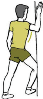
Figure B-9 Étirement de la poitrine