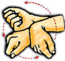
Figure B-6 Rotations des poignets

Remarque. Tiré de Exercises . Droit d'auteur 1998 par Impacto Protective Products Inc. Extrait le 26 octobre 2006 du site http://www.2protect.com/home.htm