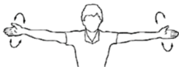
Figure B-4 Cercles des bras

Maintenez la position pendant au moins 10 secondes.