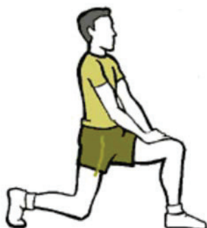
Figure B-15 Fléchisseur de hanches

Maintenez cette position pendant au moins 10 secondes.