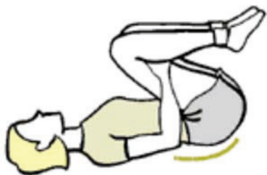
Figure B-11 Étirement du bas du dos

Remarque. Tiré de Sages Start: A Flexible Way to Get Fit . Extrait le 26 octobre 2006 du site http://www.in-motion.ca/walkingworkout/plan/flexibility .