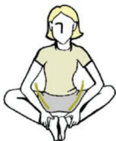
Figure B-14 Étirement des cuisses intérieures

Maintenez cette position pendant au moins 10 secondes.