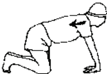
Figure B-8 Étirement des avant-bras

Maintenez cette position pendant au moins 10 secondes puis répétez l'exercice du côté opposé.