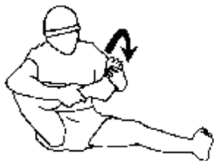
Figure B-16 Rotations des chevilles