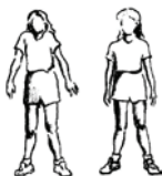
Figure B-3 Haussement des épaules

Maintenez la position pendant au moins 10 secondes.