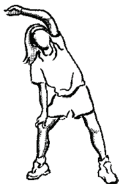
Figure B-10 Étirement des côtes

Maintenez cette position pendant au moins 10 secondes puis répétez l'exercice du côté opposé.