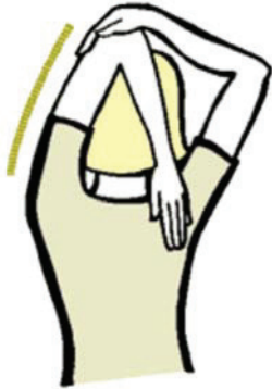
Figure B-7 Étirement des triceps

Changez de direction et répétez le mouvement de chaque côté.