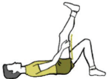
Figure B-13 Étirement de l'ischio-jambier

Remarque. Tiré de Sages Start: A Flexible Way to Get Fit . Extrait le 26 octobre 2006 du site http://www.in-motion.ca/walkingworkout/plan/flexibility/ .