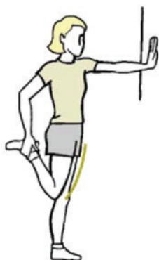
Figure B-18 Étirement des quadriceps

Maintenez cette position pendant au moins 10 secondes puis répétez l'exercice du côté opposé.