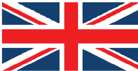
Figure 1-1-3 Le drapeau royal de l'Union à deux croix

Site Web de Patrimoine canadien – www.patrimoinecanadien.gc.ca